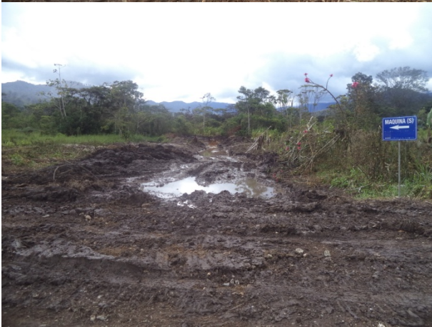
ECSA CAUSA DAÑOS A SAN MARCOS-TUNDAYME