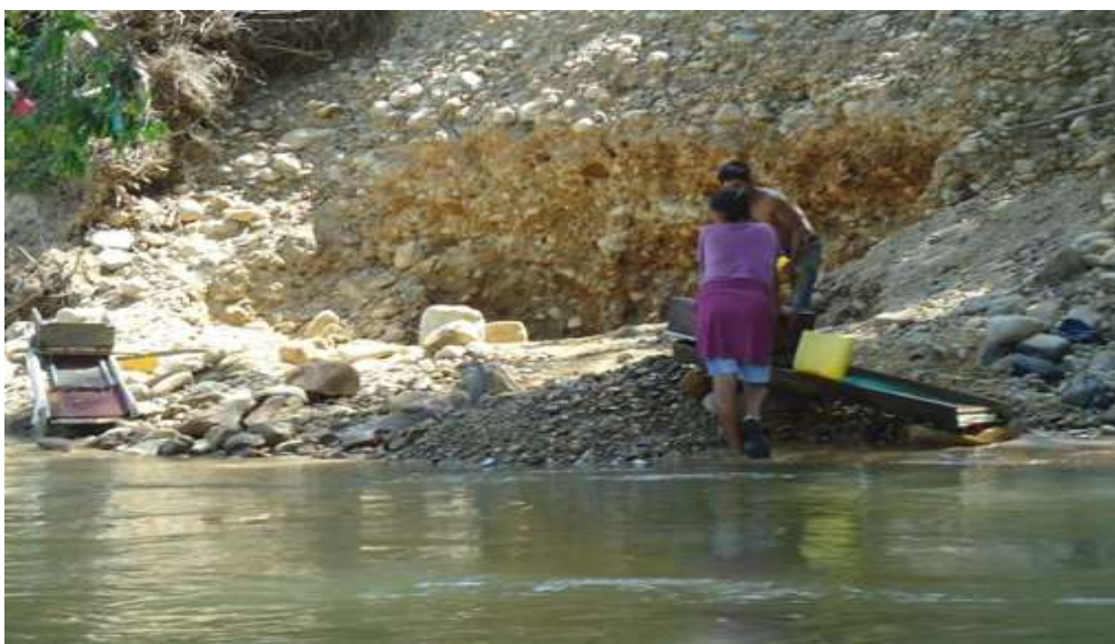
Minería con canalón en el río Zamora

difícil conseguirlo, pues no está disponible para la venta. La separación final del oro se lo hace por fundición. Algunos mineros aún utilizan la extracción de las chispas de oro mediante un imán, sin usar mercurio.