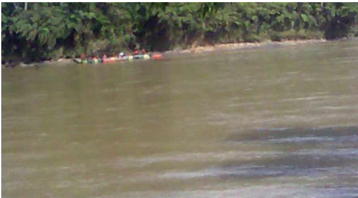
Captura de video tomado el 7 de noviembre de 2013, proporcionado por los pobladores, en donde se aprecia al primer bote de los militares, antes de llegar a la playa de Tutus