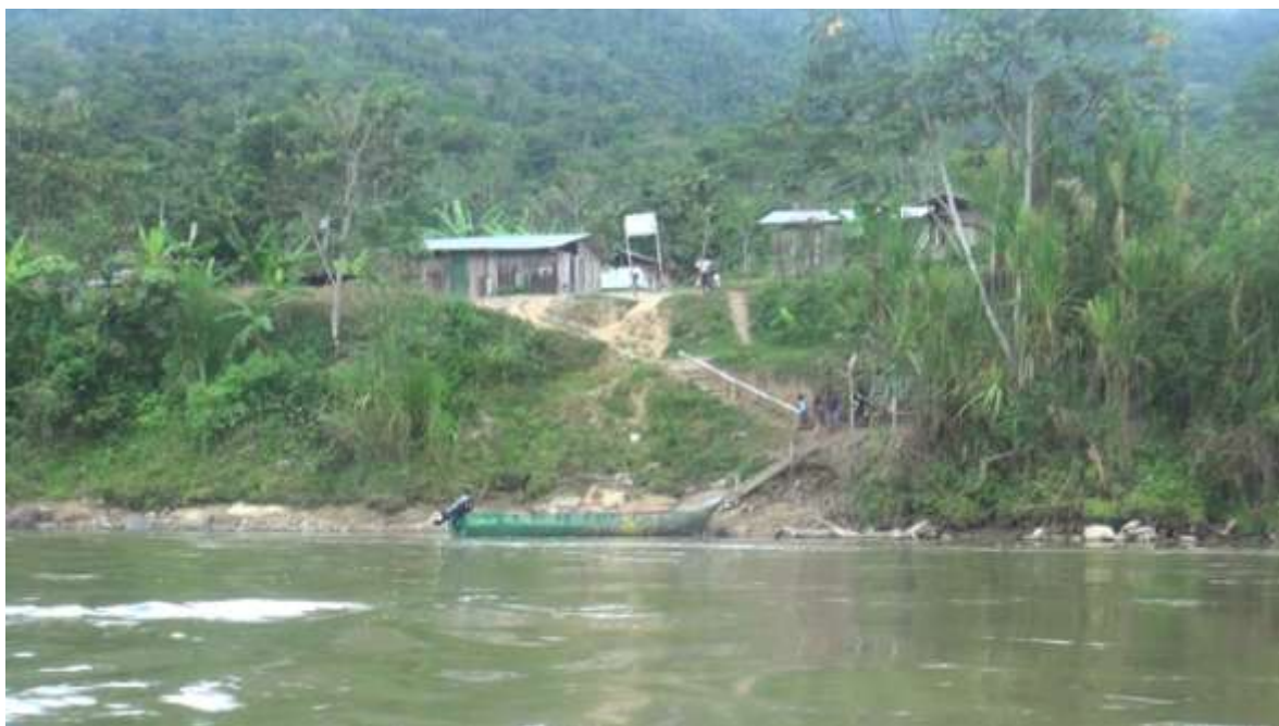
Foto del puerto de Campanak Entza, el 12 de noviembre de 2013, día de nuestra visita, en donde se aprecia que es el mismo lugar presentado por el gobierno.

Algunas versiones que se recogieron argumentaron que el video presentado por el gobierno constituye un montaje y es falso; sin embargo, un análisis del mismo, comparándolo con los videos recogidos en esta investigación del 12 de noviembre, se determina que son reales y no hay montajes de videos filmados en otro sitio o en otro río.