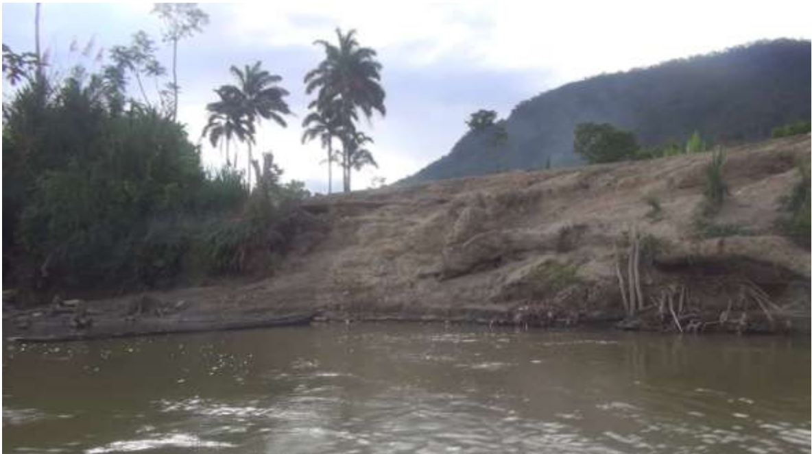
Shiran Entza, sitio desde el que partió la patrulla militar. el martes 12 de noviembre de 2013. En la parte superior termina la carretera que viene desde Las Peñas

De acuerdo a los testimonios recogidos, la patrulla militar llegó por tierra, por una carretera de tercer orden que une el sector Las Peñas, en la vía Gualaquiza - Loja, con el sector denominado Shiran Entza, en territorio shuar, a la orilla izquierda del río Zamora, si se considera la dirección de las aguas. Shiran Entza es un sitio de encuentro comercial, allí se realiza una feria todos los días viernes en donde colonos y shuar venden y compran mercadería o alimentos: los colonos generalmente llegan por la carretera y los shuar arriban por el río desde diversos caseríos. Algunas de las transacciones en esta feria se realizan con gramos de oro, cotizados al momento en 30 dólares el gramo.