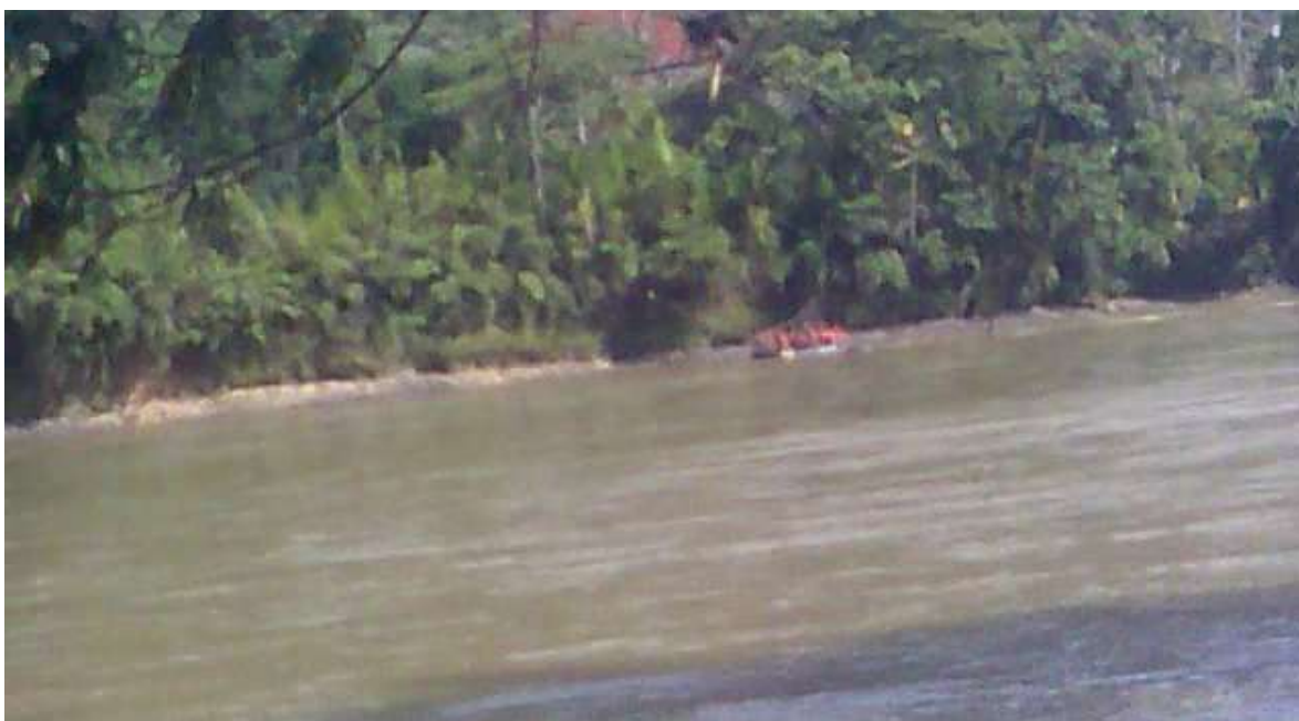
Captura de video tomado el 7 de noviembre de 2013, proporcionado por los pobladores, en donde se aprecia al segundo bote de los militares, antes de llegar a la playa de Tutus