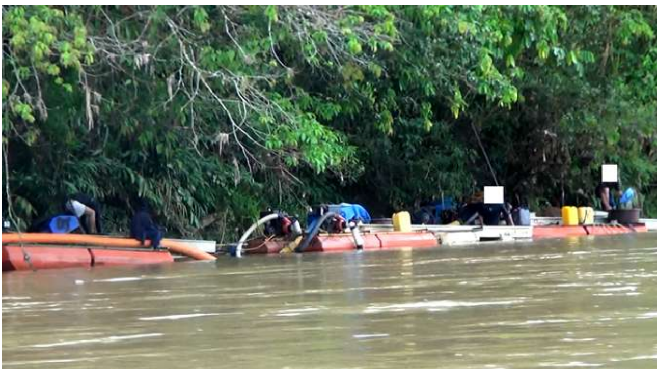
Dragas operando en el río Zamora

La práctica general es llevar el último recipiente de arena a casa para continuar con el lavado; se lleva alrededor de medio galón de arena y agua. En el proceso final se llega a tener una mezcla de unos diez gramos de arena y chispas de oro; aquí el minero decide qué cantidad de mercurio va a utilizar, calcula una gota de mercurio por cada posible gramo de oro que, como se dijo, oscila entre uno y tres gramos.