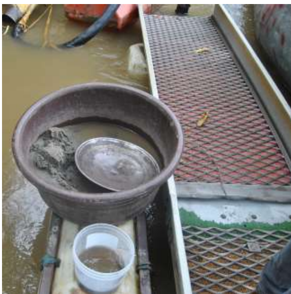
Canalón, tinaja, batea y recipiente que se lleva a casa para seguir con el proceso de lavado

La arena recogida por las cobijas o los sacos de yute se coloca en una tinaja, en donde se empieza el proceso de lavado con una batea, para eliminar la arena.