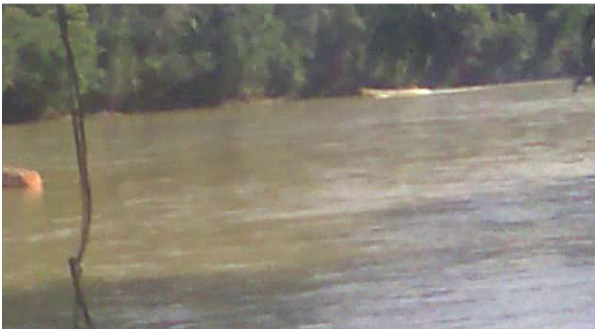
Captura de video tomado el 7 de noviembre de 2013, proporcionado por los pobladores, en donde se aprecia a un bote que baja antes de los botes de los militares

Los militares también han asegurado que documentaron todo el operativo y han ido publicando videos de manera paulatina, y es coincidencia que lo vayan publicando acorde avanzaban las investigaciones de las autoridades indígenas, pues desde su primera versión de que no estaban armados, han cambiado a una en la que buscan legitimar la muerte de Freddy Taish con los argumentos de legítima defensa y uso proporcional de la fuerza.